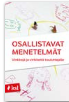
Osallistavat menetelmät – vinkkejä ja virikkeitä kouluttajalle, 2017

Tuotamme aikuiskasvatusta, kulttuuria, työelämää ja yhteiskuntaa käsitteleviä julkaisuja, joista suurin osa on maksuttomia. Voit ladata julkaisuja pdf-muodossa verkkosivuiltamme ( ksl.fi/julkaisut ) tai tilata niitä painettuna postikulujen hinnalla. Koulutamme myös julkaisujemme teemoista.