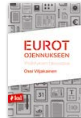
Ossi Viljakainen: Eurot ojennukseen – Yhdistyksen talousopas, 2016