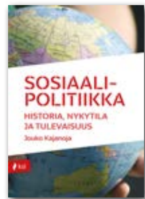
Jouko Kajanoja: Sosiaali- politiikka – Historia, nykytila ja tulevaisuus, 2016