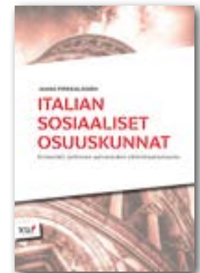
Jaana Pirkkalainen: Italian sosiaaliset osuuskunnat, 2016