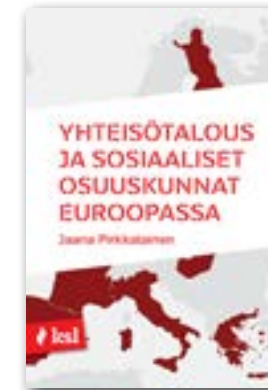
Jaana Pirkkalainen: Yhteisötalous ja sosi- aaliset osuuskunnat Euroopassa, 2017